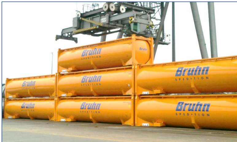
Druck-Container bereit zur Verladung