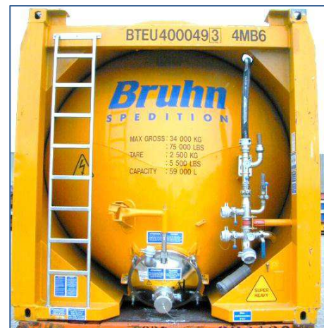
Ansicht mit Edelstahl-Auslaufschüssel