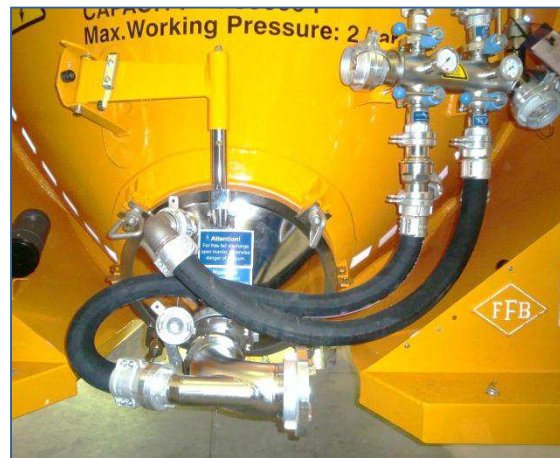
Armaturen und Auslaufschüssel aus Edelstahl